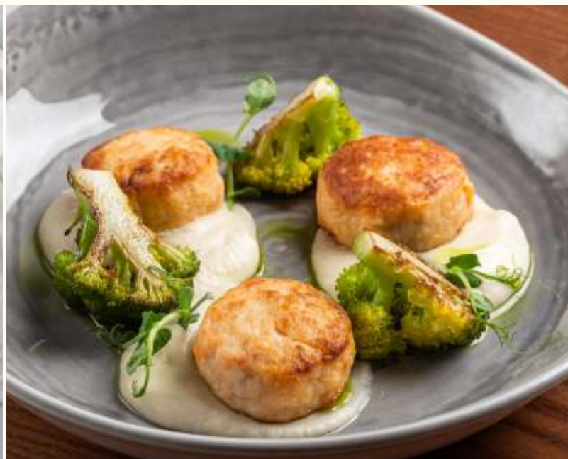
Котлеты из лосося и креветок с пюре из сельдерея 200g / 1290.-