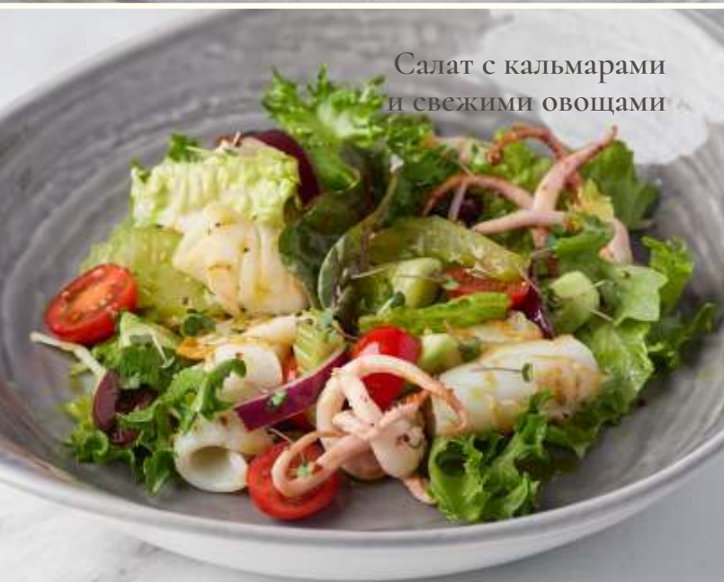
Салат с кальмарами и свежими овощами

Салат с креветками и кремом из брокколи 120g / 760.-