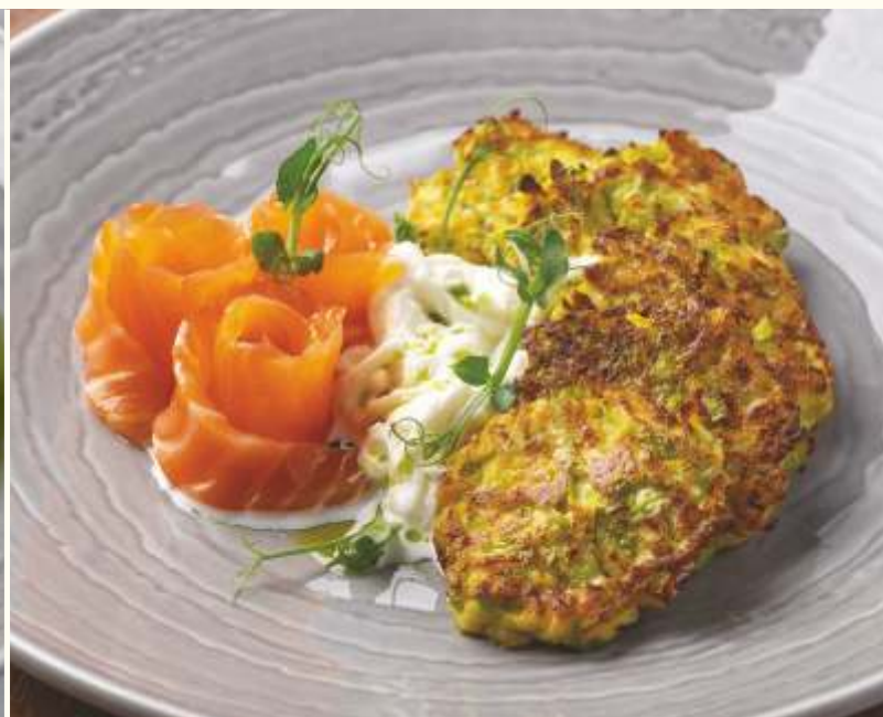
Оладьи из кабачков с лососем и сыром страчателла 190g / 1250.-

Если у вас есть аллергия на определенные продукты, просим заранее сообщить об этом официанту.