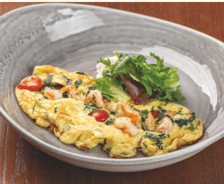
Фриттата с креветками и шпинатом 220g / 620.-