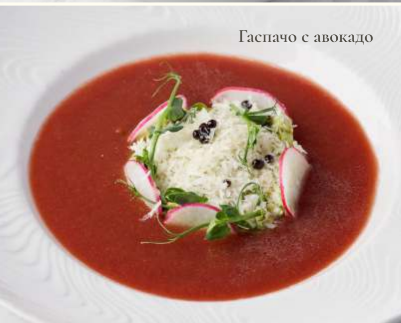
Гаспачо с авокадо