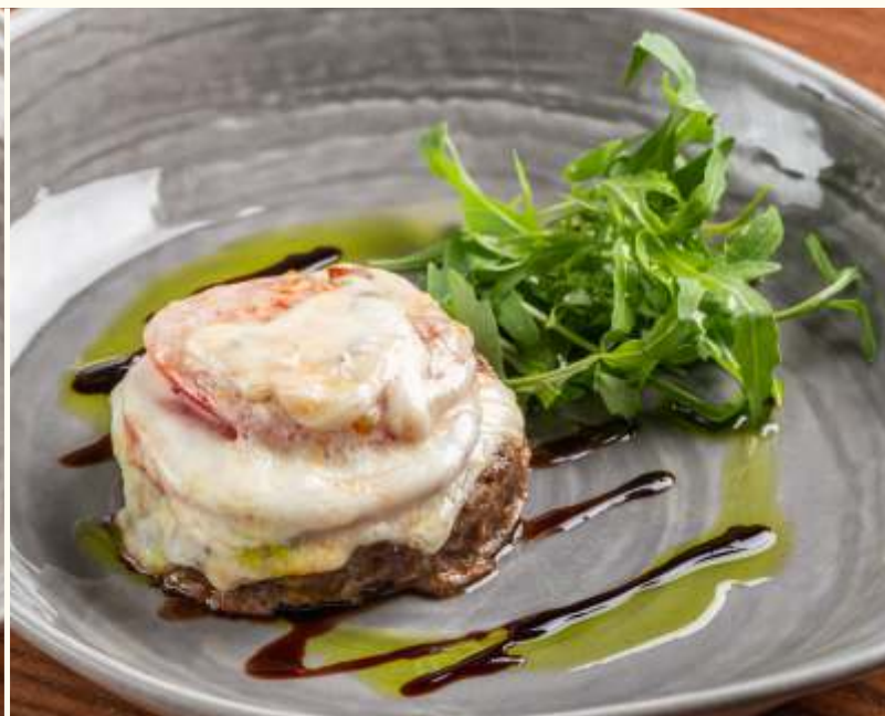
Бифштекс «Капрезе» 200g / 790.-