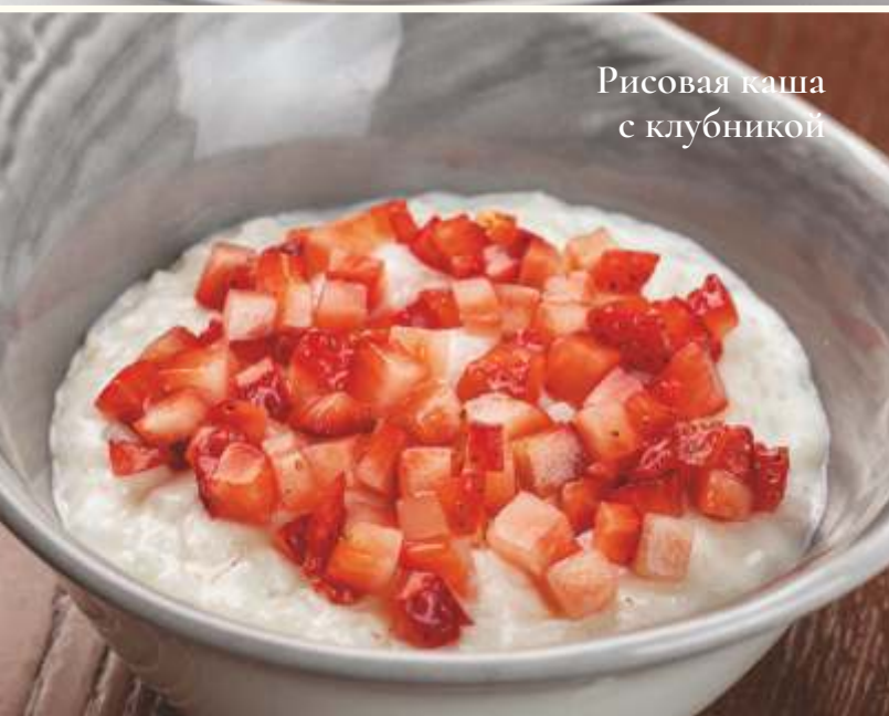
Рисовая каша с клубникой