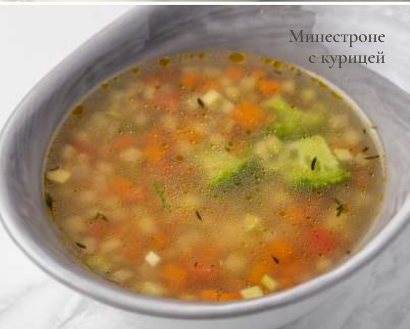
Минестроне с курицей