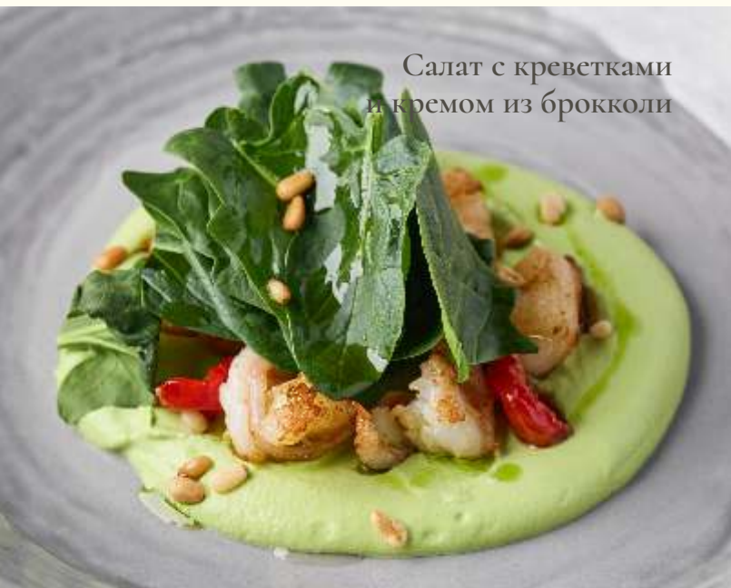
Салат с креветками и кремом из брокколи