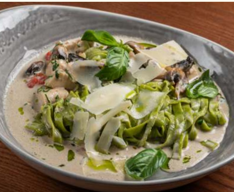
Зелёные фетучини с курицей и грибами 300g / 780.-