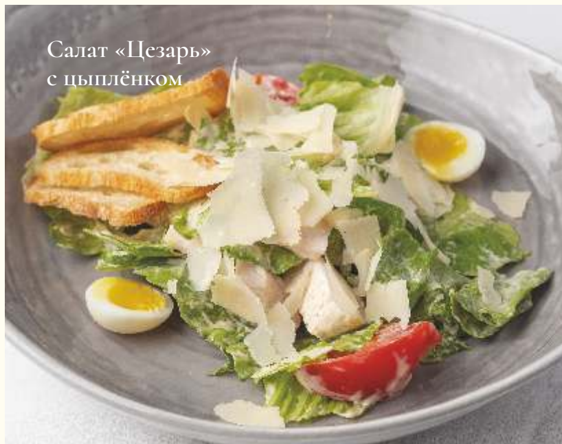
Салат «Цезарь» с цыплёнком