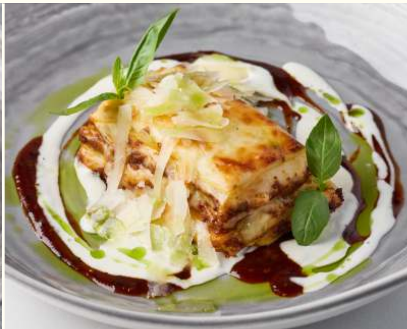
Лазанья Болоньезе 180g / 750.-

Если у вас есть аллергия на определенные продукты, просим заранее сообщить об этом официанту.