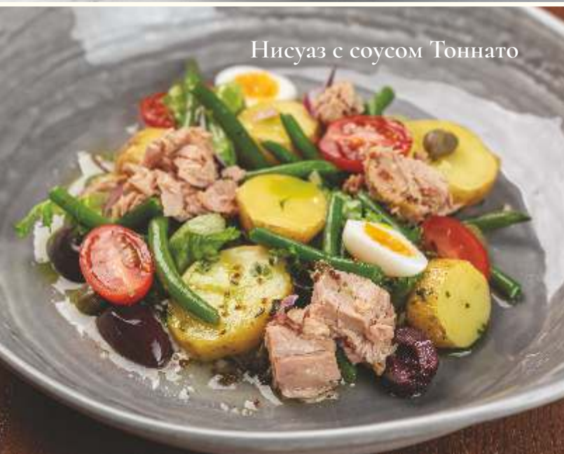
Нисуаз с соусом Тоннато

Салат с кальмарами и свежими овощами 190g / 950.-