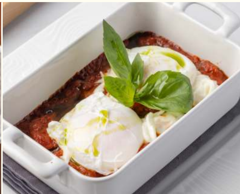
Яйца пашот со страчателлой и томатно-перечным рагу 270g / 630.-