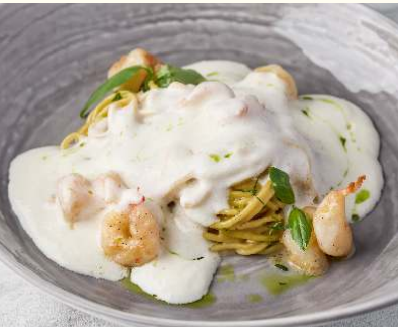
Лингвини Качо э пепе с креветками 250g / 890.-