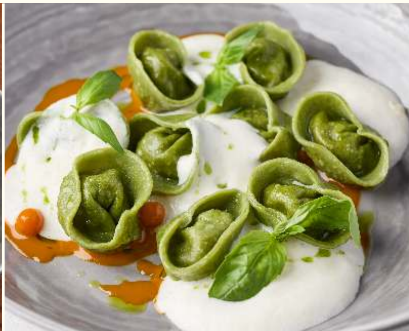
Равиоли с уткой и муссом пармезан 210g / 990.-

Если у вас есть аллергия на определенные продукты, просим заранее сообщить об этом официанту.