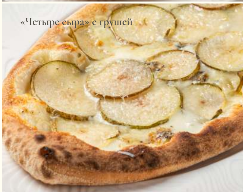
«Четыре сыра» с грушей