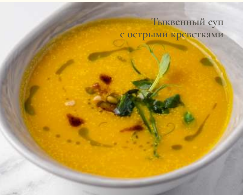
Тыквенный суп с острыми креветками