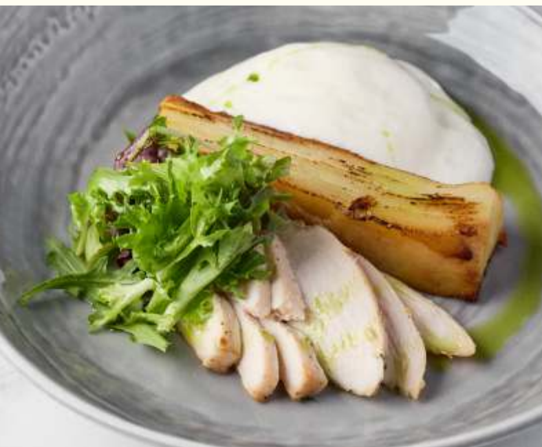
Яйцо пашот под муссом пармезан с цыпленком и гратеном 220g / 790.-