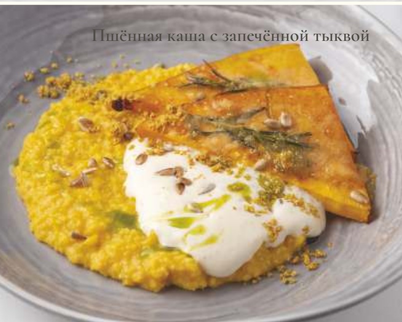
Пшённная каша с запечённой тыквой