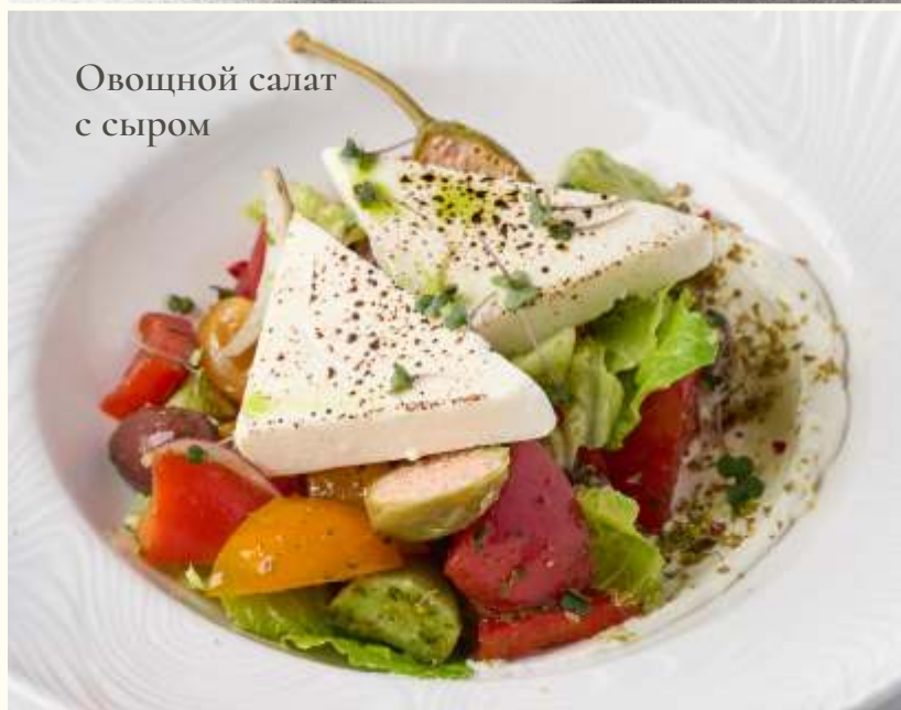
Овощной салат с сыром