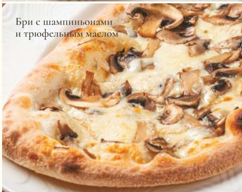
Бри с шампиньонами и трюфельным маслом