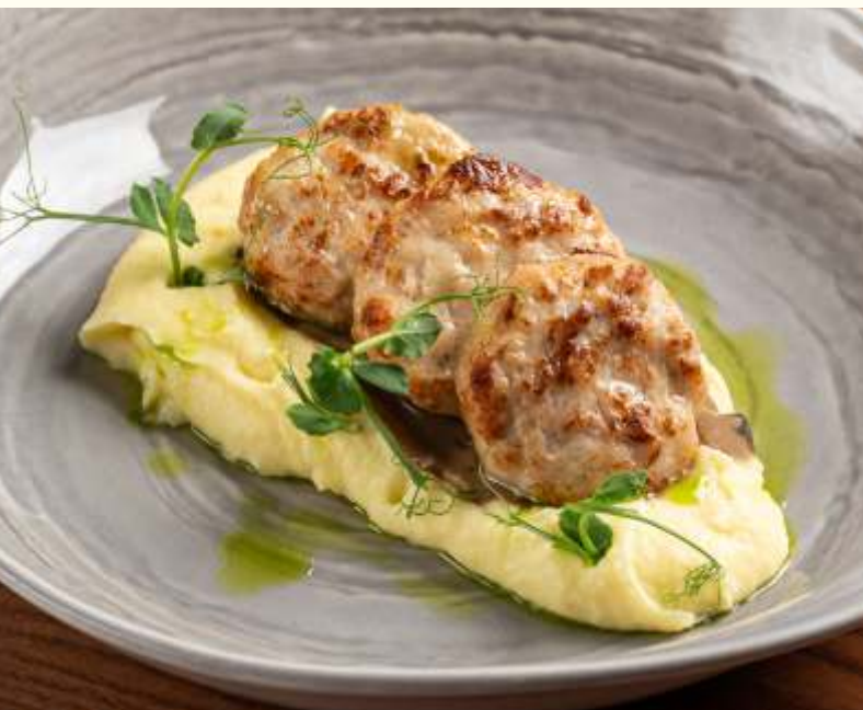
Биточки из цыплёнка с грибным соусом и пюре 290g / 690.-