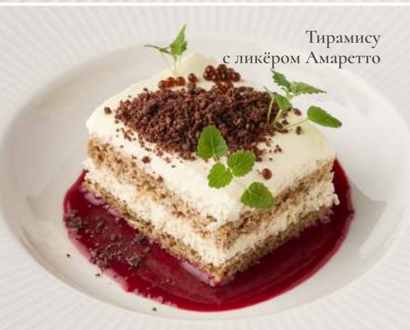
Тирамису с ликёром Амаретто

Тирамису с ликёром Амаретто 140g / 470.-