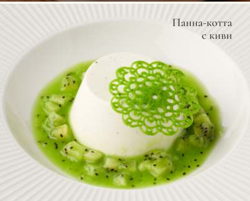
Панна-котта с киви