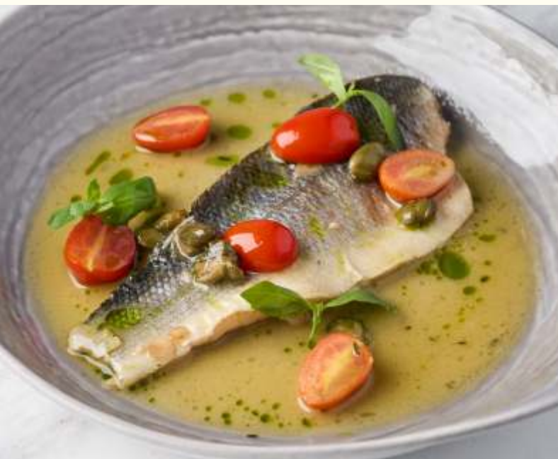
Сибас в соусе Аква пацца 250g / 1450.-